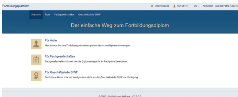
Abbildung 2: Einstiegsseite zur Fortbildungsplattform.

Die Fortbildungspflicht umfasst somit 80 Fortbildungsstunden pro Jahr. Alle drei Jahre sind 150